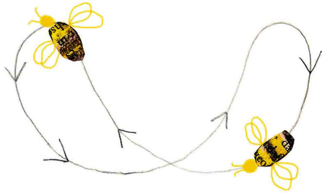
Vom Rundtanz zum Schwänzeltanz From round dance to waggle dance