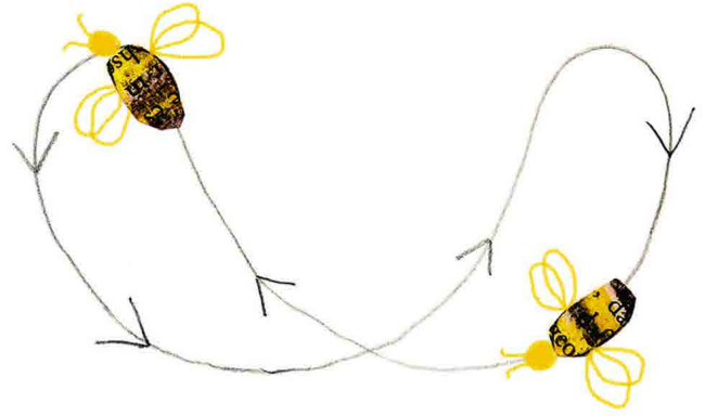
Vom Rundtanz zum Schwänzeltanz Od tańca okrężnego do tańca odwłokiem