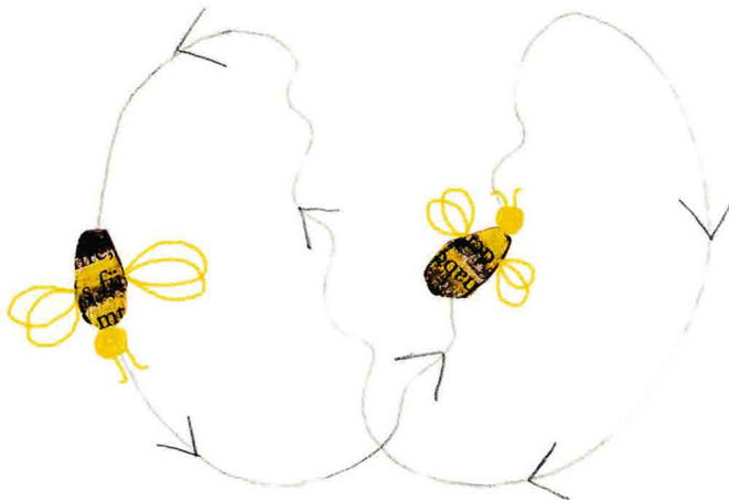
Beginnender Schwänzeltanz Rozpoczynający się taniec odwłokiem